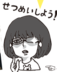
つっちゃん (新小6てんちよう)