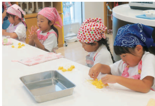
スノーボールクッキー作りの様子