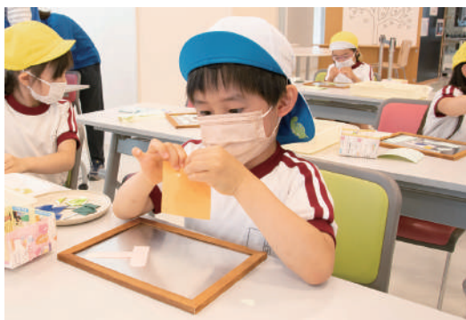
かぼちゃのおだんご作りの様子

発達段階に応じたかんたんな工作・クッキング体験を行います。作った作品はお持ち帰りいただけます。