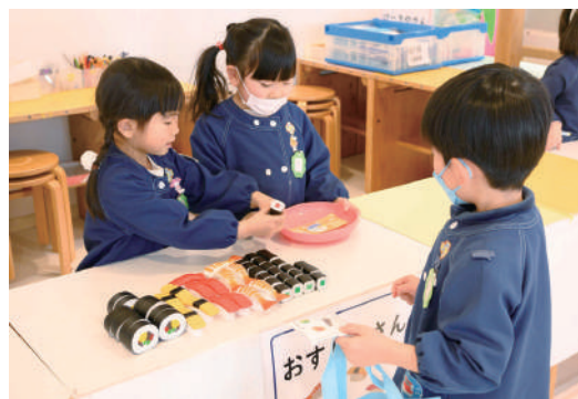
お店やさんごっこスタート