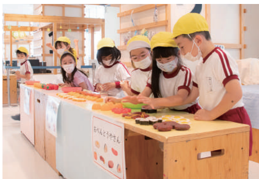
お店やさんの準備